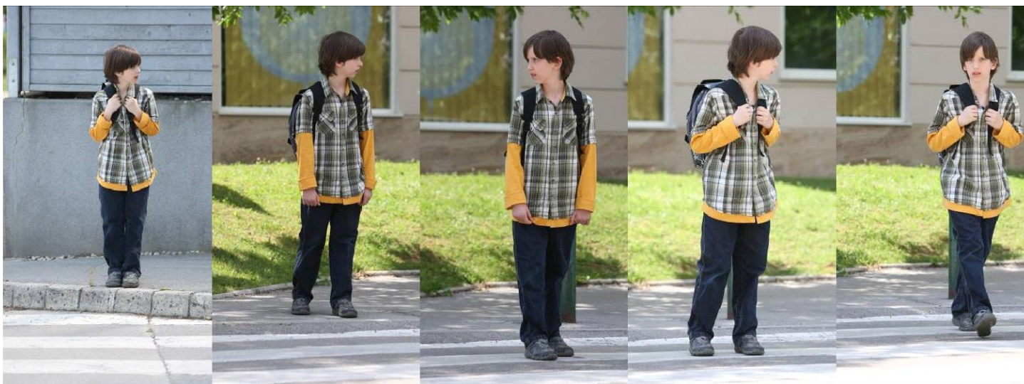
Se ustavim na robu