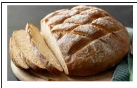
1. stran kartončka

Naredi si kartončke za besedišče, ki smo ga zapisali v zvezke – FOOD. Postopek poznaš, pa vseeno kratka osvežitev: